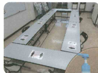
ソーシャル ディスタンス 消毒と除菌