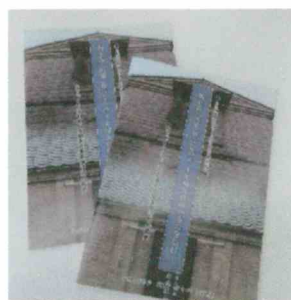
まちづくり玉村塾活動報告書

まちづくり玉村塾は、令和元年度の活動報告とともに33回にわたる赤煉瓦倉庫（愛称「たまむら大正館」）で行った実験活用の実績をまとめました。活動報告書はB5サイズのカラー版19ページあり、300部発行しました。報告書は、生涯学習課文化財係（玉村町文化センター内）で入手することができます。また、今後の赤煉瓦倉庫でのイベントでも資料として来場者に配布される予定です。