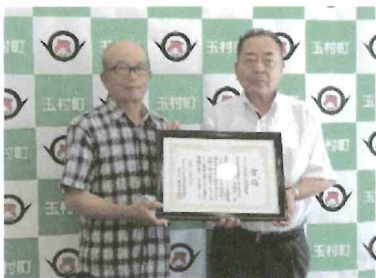
石川町長に受賞報告

会では、この受賞を石川町長に報告すると共に、今後の活動について関係団体と連携をとりながら、さらなる環境整備・美化活動に力をいれたいと抱負を伝えました。