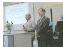
ぱるのあゆみを紹介 COROぴあちえーれ活動紹介