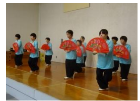
健康にも効果的な太極拳