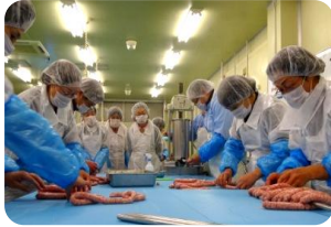
ウィンナー作り体験の様子