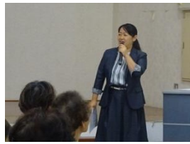
フレイルは予防が大切！