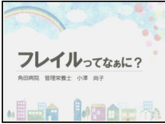
フレイルってなあに？