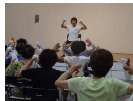
タオルを使った健康体操