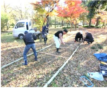
整備する会員たち