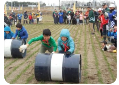
ドラム缶で麦踏みリレーの様子

冬の風物詩“麦踏み”の農作業を競技にして争うという農作業競技型体験イベント「麦踏み合戦&おっきりこみ」が昨年に引き続き開催されることになりました。耕うん機試乗体験コーナーやおっきりこみの無料配布もあり、だれでも楽しむことができますのでぜひご参加ください。