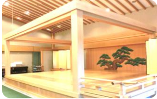
能舞台のある会場