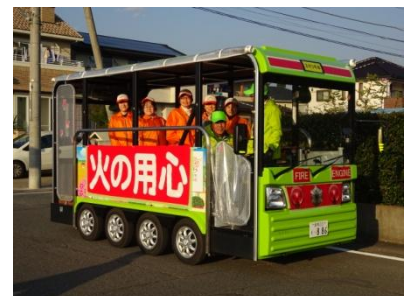
消防車「玉村3号車」で防火の呼びかけ

当日は、バスのボディーに「火の用心」の横断幕を付け、消防車仕様の「玉村3号車」に変身して、消防署員や女性防火クラブのメンバーを乗せて町内を巡回しました。