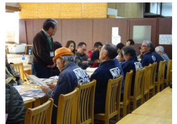
みどり市観光ガイドの会との交流会

みどり市観光ガイドの会の方々との交流会では、「とにかく無理なく、自分たちが楽しみながらやること」などのアドバイスをいただきました。