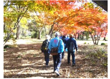
フォレストウォーキング

11月26日（日）には、「秋を楽しむフォレストウォーキング」が開催され、参加者たちは整備したばかりのもみじ回廊を気持ち良く歩いていました。